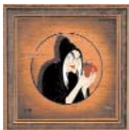
Fig. 2: La Strega in Biancaneve e i 7 nani.