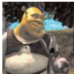
Fig. 14: Shrek.

Una cicatrice del volto molto evidente, in altri casi utilizzata come tratto caratterizzante negativo (vedi il personaggio Scar di “The Lion King”) è invece uno dei tratti distintivi di Harry Potter, e ne ricorda a tutti la potenza magica. Cicatrici multiple, come quelle visibili negli esiti di incidenti stradali, sono invece il tratto saliente di Sally (Fig. 15), fidanzata buona e innamorata di Jack Skeletron in “The Nightmare before Christmas” di Tim Burton.