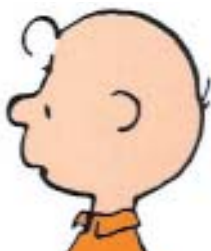
Fig. 13: Charlie Brown.

Il buonissimo Cucciolo di Biancaneve e i Sette Nani è chiaramente affetto da alopecia areata totale (ciglia e sopracciglia sono presenti), stessa patologia che affligge Charlie Brown (Fig. 13) dei “Peanuts” e, tra i personaggi adulti, i “buoni” Fester Addams del film “Addams Family” e il più recente “Shrek” (Fig. 14).