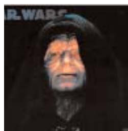
Fig. 11: L'Imperatore di Guerre Stellari.

Nella saga "Stars Wars", l'Imperatore (Fig. 11), dominatore del lato oscuro della forza, presenta un quadro forse compatibile con una neurofibromatosi tipo I, mentre in "Batman", il gangster "two faces" sembra affetto da una Sturge-Weber. I denti conici di Ades ("Hercules" Disney) potrebbero evocare una displasia ectodermica, mentre invece è evidente il richiamo alla progeria nell'ambiguo personaggio Dobby di "Harry Potter" (Fig. 12).