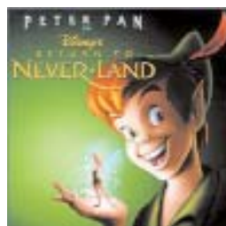
Fig. 16: Peter Pan.

inconfondibile, fanno pensare ad una sindrome, in particolare alla sindrome di Williams (naso all’insù, socievolezza estrema, attenzione limitata nel tempo, entusiasmo, occhi “brillanti”).