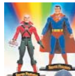
Fig. 10: Lex Luthor ("Superman").

Sindromi. Anche varie sindromi sono state utilizzate per dare una connotazione negativa al personaggio di una storia.