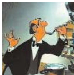
Fig. 7: Edgar ("The Aristocats").

Alopecia. La calvizie è una patologia classicamente utilizzata da tutto il cinema, anche quello dedicato agli adulti, per caratterizzare immediatamente il cattivo della storia e c'è quasi una proporzione diretta tra l'entità del problema e la malvagità del personaggio. Se infatti Edgar, il maggiordomo degli "Aristogatti" cattivo ma pasticcione (Fig. 7) e Mr Burns (Fig. 8) dei "Simpson" presentano una classica alopecia androgenetica, Voldemort del film "Harry Potter" (Fig. 9), incarnazione del male assoluto, è afflitto da alopecia totale. Stesso problema, e stessa malvagità, presentano il Giudice di "Chi ha incastrato Roger Rabbit" e Lex Luthor (Fig. 10), nemico numero 1 di "Superman".