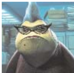
Fig. 4: Roz ("Monsters" Pixar-Disney).

Piebaldismo. La presenza di un ciuffo bianco di capelli viene invece largamente utilizzata per esprimere "doppiezza" e inaffidabilità. Presentano un ciuffo acromico Cruella De Vil, la cattiva della "Carica dei 101" (Fig. 5), la matrigna di Cenerentola -"Cinderella" Disney- (Fig. 6), il Gremlin cattivo dell'omonimo film di Joe Dante. In tutti questi personaggi c'è una apparente, iniziale, bontà d'animo che si trasforma in malvagità nel corso della storia.