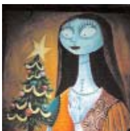
Fig. 15: Sally.

Lo stesso Peter Pan (Fig. 16) presenta alcune caratteristiche somatiche, anche se non esclusivamente dermatologiche che, pur rendendolo