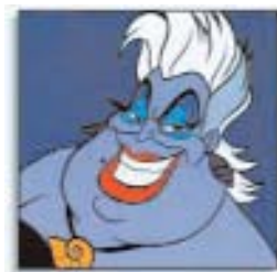
Fig. 1: Ursula nel film La Sirenetta.