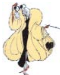
Fig. 5: Cruella De Vil (La carica dei 101).

Piebaldismo. La presenza di un ciuffo bianco di capelli viene invece largamente utilizzata per esprimere "doppiezza" e inaffidabilità. Presentano un ciuffo acromico Cruella De Vil, la cattiva della "Carica dei 101" (Fig. 5), la matrigna di Cenerentola -"Cinderella" Disney- (Fig. 6), il Gremlin cattivo dell'omonimo film di Joe Dante. In tutti questi personaggi c'è una apparente, iniziale, bontà d'animo che si trasforma in malvagità nel corso della storia.