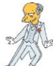
Fig. 8: Mr Burns ("The Simpson").