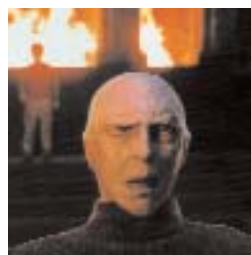
Fig. 9: Lord Voldemort ("Harry Potter").