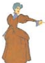
Fig. 6: La matrigna (Cenerentola).

Alopecia. La calvizie è una patologia classicamente utilizzata da tutto il cinema, anche quello dedicato agli adulti, per caratterizzare immediatamente il cattivo della storia e c'è quasi una proporzione diretta tra l'entità del problema e la malvagità del personaggio. Se infatti Edgar, il maggiordomo degli "Aristogatti" cattivo ma pasticcione (Fig. 7) e Mr Burns (Fig. 8) dei "Simpson" presentano una classica alopecia androgenetica, Voldemort del film "Harry Potter" (Fig. 9), incarnazione del male assoluto, è afflitto da alopecia totale. Stesso problema, e stessa malvagità, presentano il Giudice di "Chi ha incastrato Roger Rabbit" e Lex Luthor (Fig. 10), nemico numero 1 di "Superman".